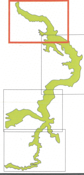
Tableau d'assemblage du DOCOB VIS - VIRENQUE