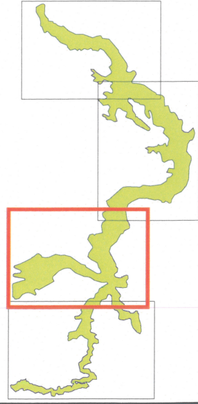
Tableau d'assemblage du DOCOB VIS - VIRENQUE