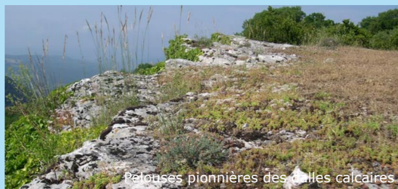
Pelouses pionnières des dalles calcaires