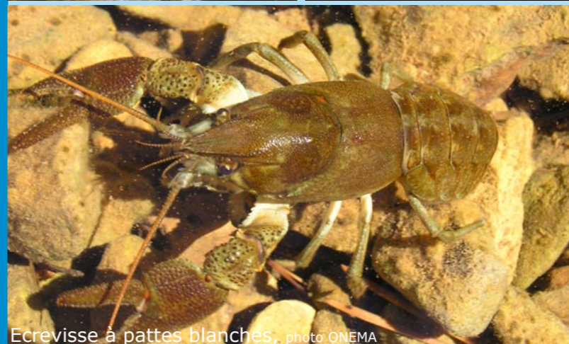
Ecrevisse à pattes blanches